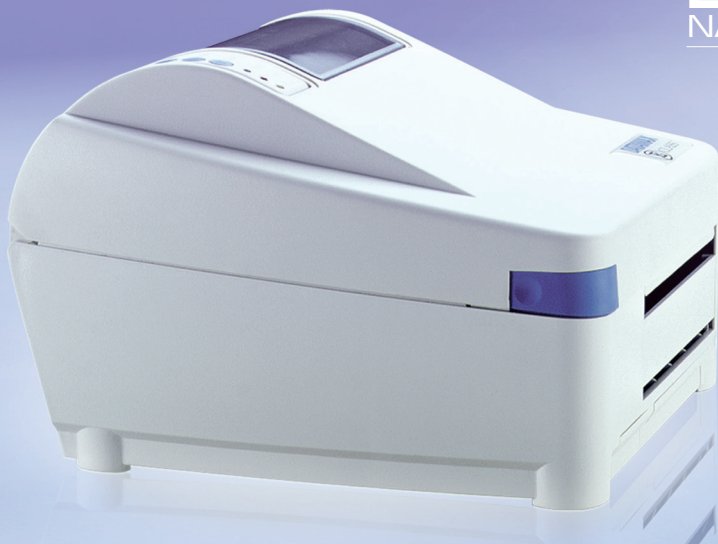
DRUKARKA DATAMAX E4205e